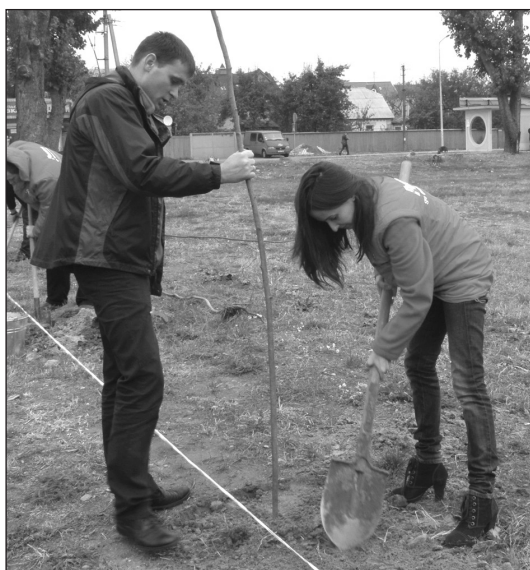
Посадку дерев здійснюють працівники торговельного гіпермаркету "Ашан"

Писати про успіхи приємно завжди. І хоч в деякого це й може викликати порівняння з відповідним радянським періодом, коли "успіхи" були суцільними в усьому, я стверджую: в нашій Петропавлівській Борщагівці останнім часом результати роботи громади множаться на очах. Про