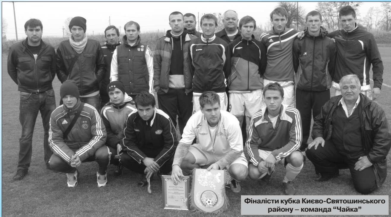
Фіналісти кубка Києво-Святошинського району – команда "Чайка"