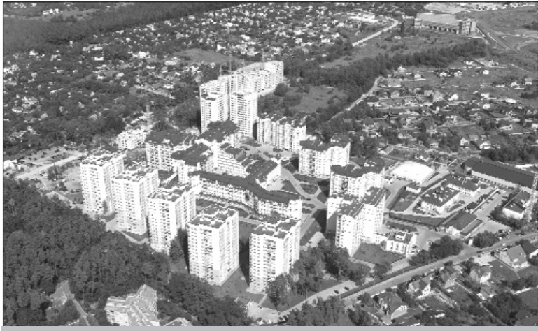
Житловий комплекс “Чайка” – 2011 рік