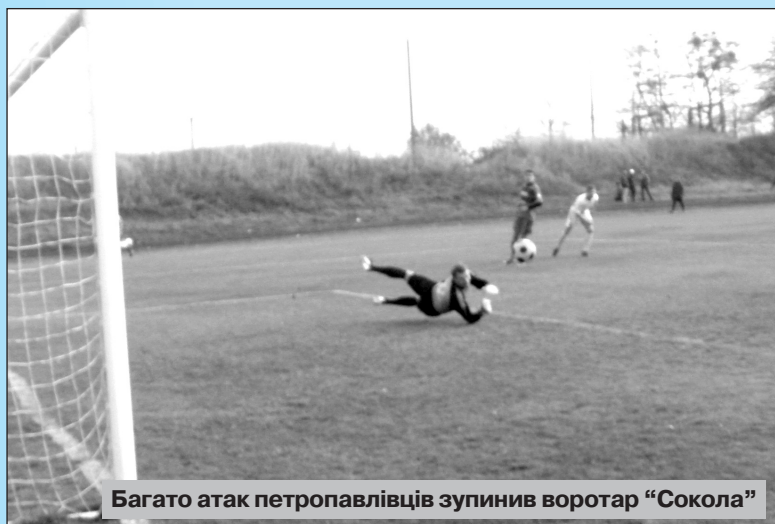
Багато атак петропавлівців зупинив воротар "Сокола"

У минулому номері нашої газети ми повідомляли про закінчення обласної першості Київської області з футболу, яка завершилась блискучою перемогою "Чайки" над київським "Монолітом" з рахунком 6:0. А тепер можемо підбити попередні підсумки успішного виступу команди в обласних змаганнях.