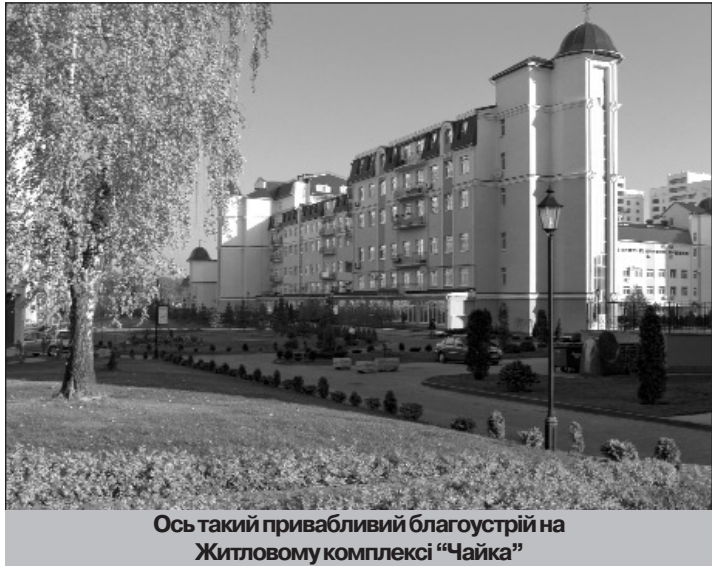
Ось такий привабливий благоустрій на Житловому комплексі "Чайка"

Не забуваючи про це, я, як сільський голова, докладаю усіх зусиль для створення належних умов для заняття фізичною культурою і спортом дітей і молоді. Після спорудження приміщення нового дитсадку і адміністративного приміщення сільської ради ми акумулювали кошти для зведення спортивного майданчика з мініфутболу, футбольне поле зі штучним покриттям, на яких можна тренуватися і змагатися в будь-яку пору року.