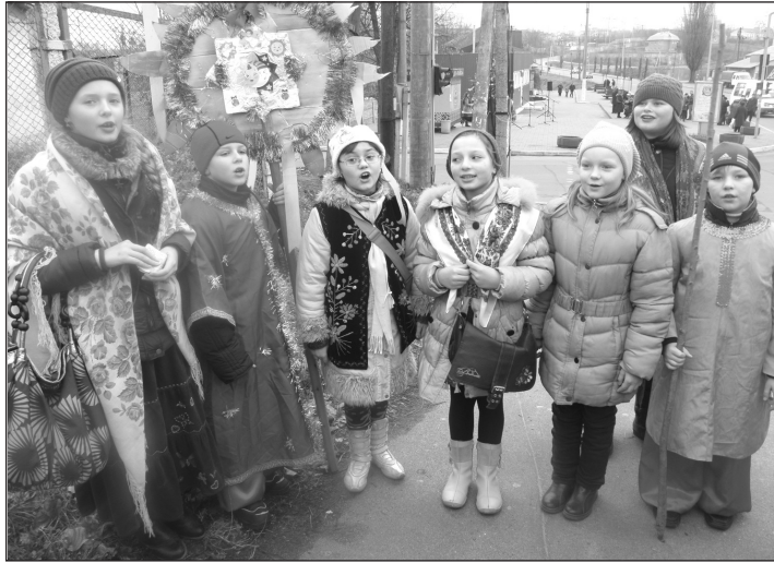
Початок на 1 стор.

До свята належно підготувався й хор "Барви". Саме він разом з дитячим ансамблем "Мальви" відкрили невелику концертну програму, присвячену Різдву Божому. А розпочали самодіяльні артисти з пісні "Нова радість стала". Її підтримали й мешканці села Петропавлівська Борщагівка. Тому зазвучала пісня піднесено, урочисто й вразила глибиною звучання.