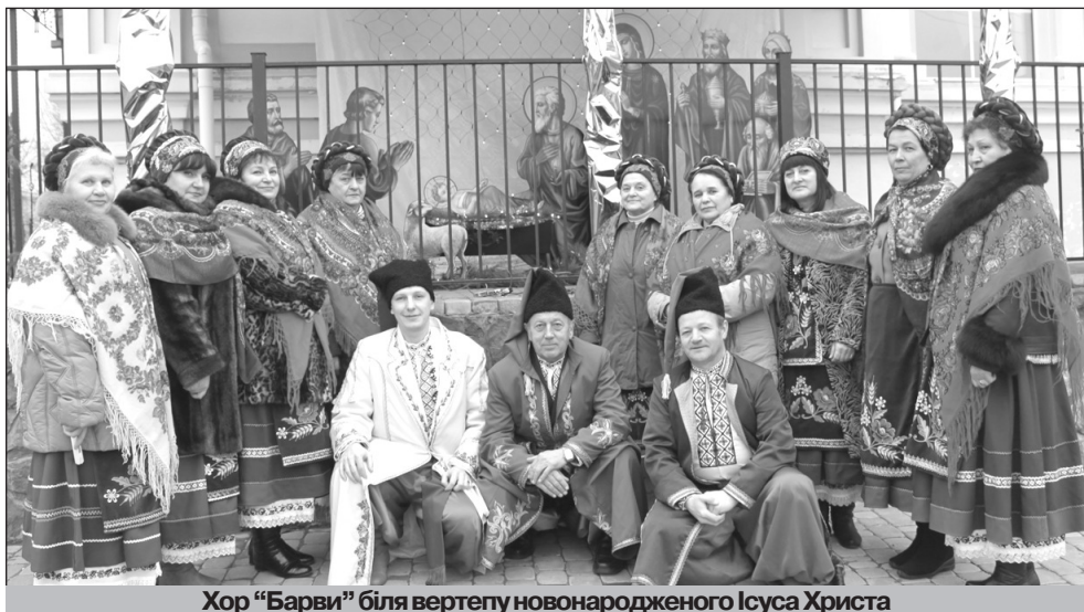
Хор "Барви" біля вертепу новонародженого Ісуса Христа