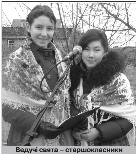
Ведучі свята – старшокласники