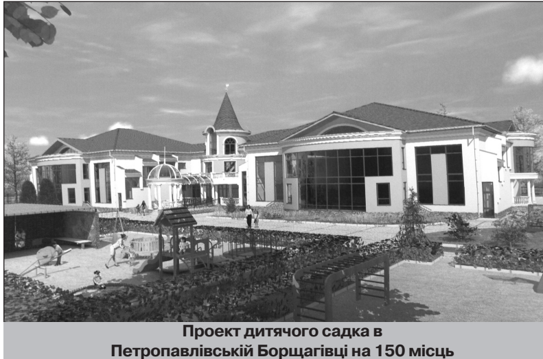
Проект дитячого садка в Петропавлівській Борщагівці на 150 місць

Також великого значення ми надаємо й зведенню Будинку дитячої творчості. В нашому селі багато талановитих дітей, які вже зарекомендували себе не тільки на районних й обласних шкільних конкурсах, спартакиадах, а й на всеукраїнських. А для подальшого розвитку цієї важливої