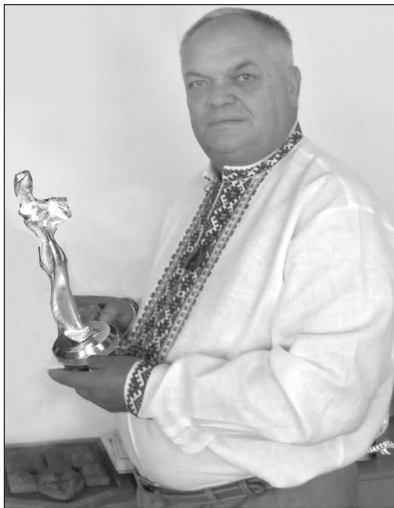
зації та відродження культурної спадщини і розвиток Всеукраїнської програми історико-краєзнавчих досліджень».

Під час урочистостей кращим представникам еліти України було вручено книгу «Золотий фонд нації», статуетку-символ України і подяку, в якій викарбувано слова: «За вагомий внесок у справу популяри-