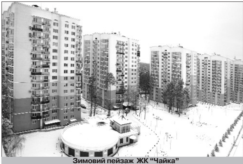
Зимовий пейзаж ЖК "Чайка"

Так детально на цьому зупинився тому, що всі роки моєї діяльності на посаді сільського голови (а це вже майже 29 років) це був чи не єдиний період, який був характерним в певні проміжки часу топтанням на місці. Я ж