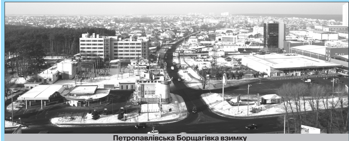
Петропавлівська Борщагівка взимку