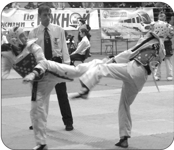
Початок на 1 стор.

й у міжнародних турнірах: у Швеції, Білорусі та ін. І от – найвище досягнення, але вже серед дорослих. У підсумку не тільки чемпіонський титул, а й звання майстра спорту!