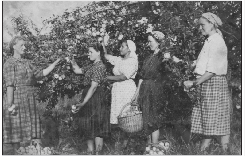
Колгоспна садова бригада (1953 рік)

Вже по закінченню війни, десь у 1952 році, був