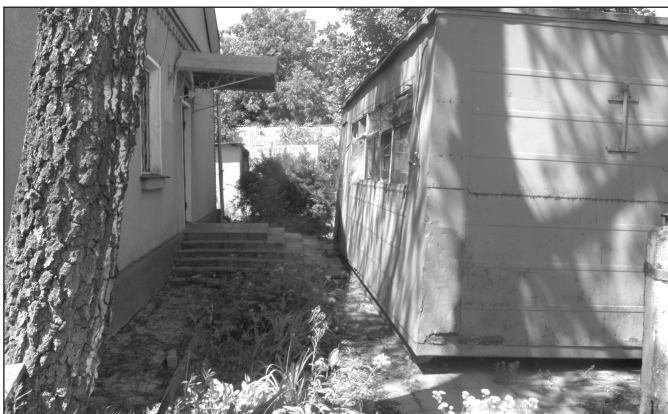
Днями розпочалося реконструкція колишнього дитсадка "Малютко", де вже ближчим часом постане Центр творчості дітей та юнацтва