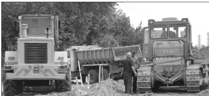
Чимало незручностей довелося пережити мешканцям села Чайки у зв'язку з розбудовою населеного пункту. Тепер на дорогу, що знову з'єднає його з Петропавлівкою, прийшли будівельники...

– Цілком згоден. Всі ми були молодими та, в душі, такими й залишились. Тому я добре