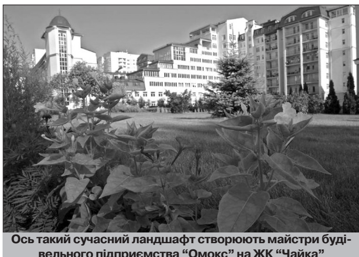
Ось такий сучасний ландшафт створюють майстри будівельного підприємства "Омокс" на ЖК "Чайка"