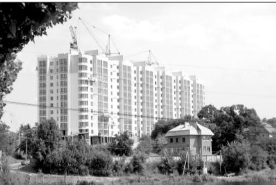
Оздоблювальні роботи ведуться на першому будинку ЖК "Щасливий".

Кілька кілометрів від Києва по Житомирській трасі - і ви потрапляєте в тихі, казкові, мальовничі місця: традиційну зону відпочинку в околицях столиці. Зовсім поруч із цією територією досі функціонують санаторні комплекси та бази відпочинку. Навколо - непередаване краси пейзажі, чисте повітря і неперевершена атмосфера спокою. Саме в цій природній ідилії замислювався колись новий медичний санаторний комплекс, який на етапі незавершеного будівництва був узятий за основу нового житлового комплексу "Чайка". Скрупульозне інженерно-конструкторське обстеження та аналіз технічного стану показали, що зовсім нові, але недобудовані корпуси перебувають у гарній технічній формі. Більше того високу