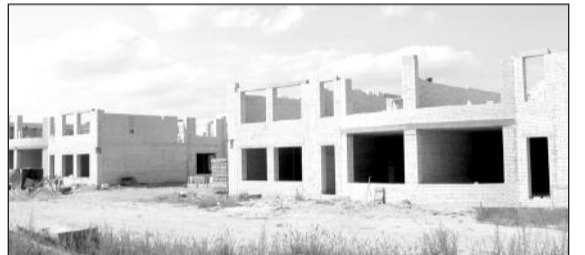
Інтенсивно здійснюється будівництво нового дитсадка на 150 місць на вул. Парковій

Вся справа в тому, що проектуючи нерухомість в ЖК "Чайка", ми створили перші в передмісті