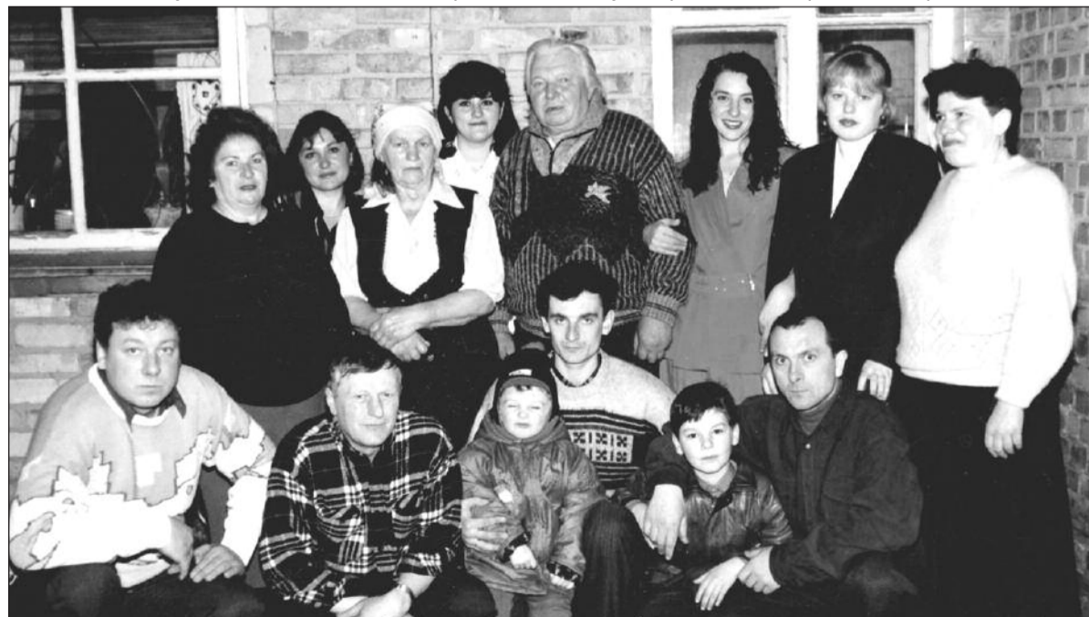
Родина Костенків на сімейному святі