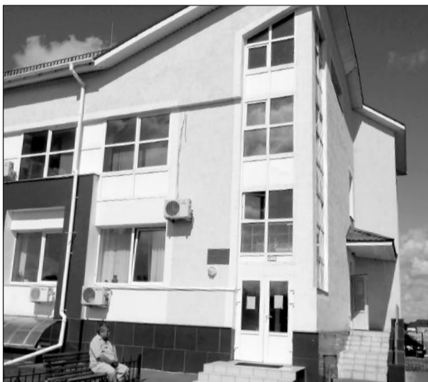
Приміщення державної реєстраційної служби Києво-Святошинського району

Заявник під час подання заяви про державну реєстрацію прав та їх обтяжень (далі - заява про державну реєстрацію) пред'являє паспорт та подає копію довідки про присвоєння ідентифікаційного коду, крім випадків, коли фізична особа через свої релігійні або інші переконання відмовляється від прийняття реєстраційного номера облікової картки платника податку, офіційно повідомила про це відповідні органи державної влади та має відмітку в паспорті громадянина України.