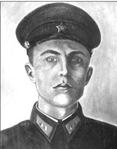
Герой Радянського Союзу І.О.Мельниченко

Історія нашого села зіткана з тисячі долів багатих душею та життєвим досвідом людей. Серед наших жителів є художники, поети, письменники, співаки та герої. Саме пам'ятник такому герою стоїть на шкільному подвір'ї в центрі нашого села, суворим поглядом спостерігаючи за нашим сьогоденням. До його підніжжя покладають квіти, приходять з цікавістю молодь. Історія його подвигу передається з вуст в уста через покоління.