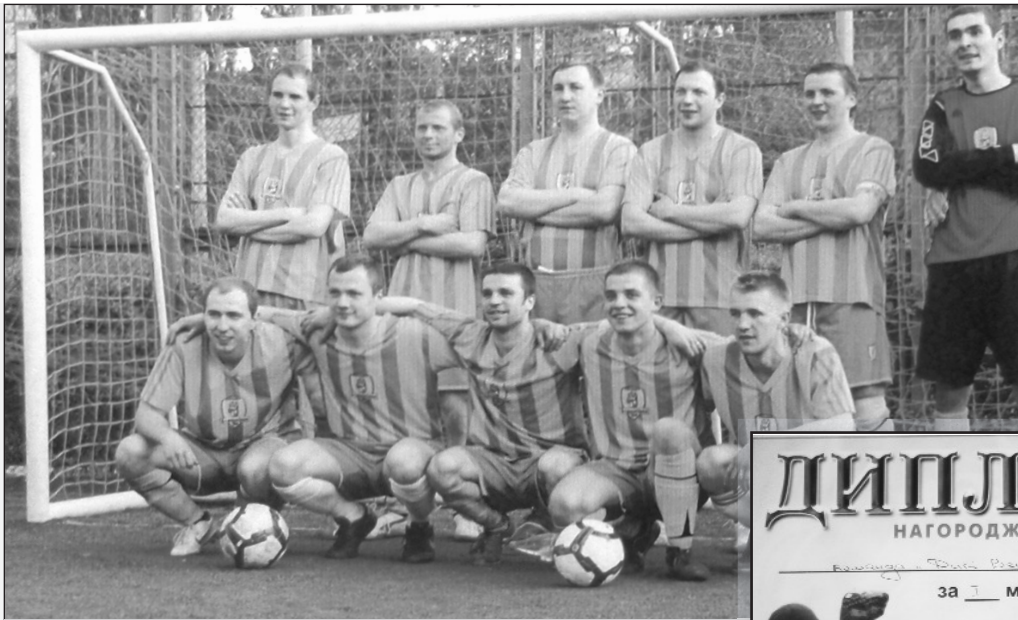
Учасники турніру з футболу – команда “ЕПІЦЕНТРУ”

Цікаво, що заняття спортом у нашому колективі – це не самоціль, а утвердження здорового способу життя. Працюючи